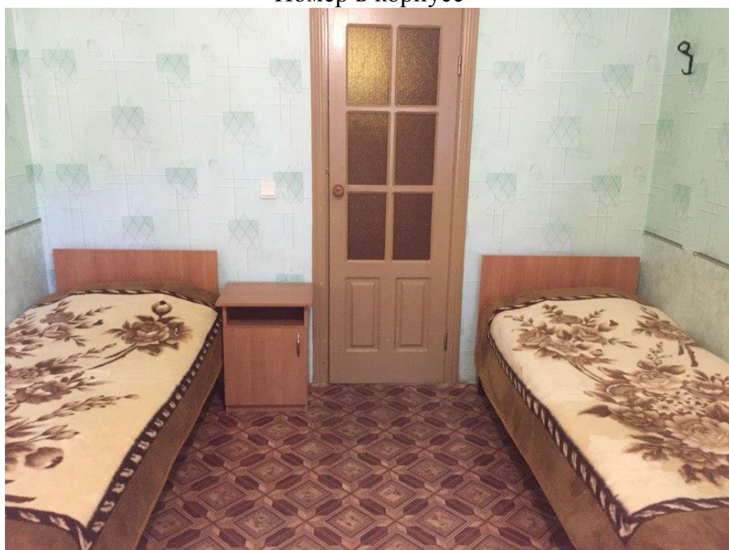
Номер в корпусе